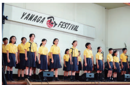
山鹿市内の園児・児童・生徒の皆さんの発表