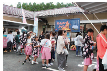
※写真は昨年のもの