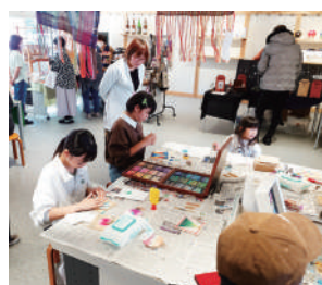
買い物だけでなくワークショップも楽しめます

■出店内容 手作りアクセサリ・小物・バッグ・服等 パン・お菓子・軽食物 人気のキッチンカー