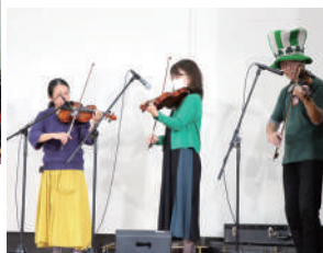
山鹿周辺のバンドが多数出演